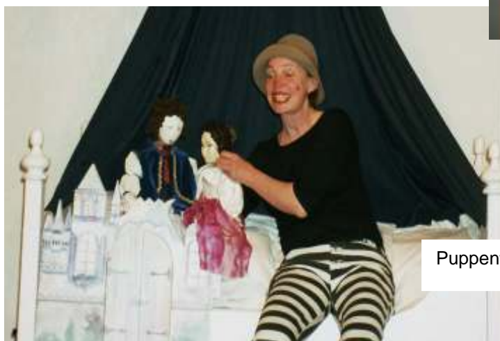
Puppentheater Gudrun Wunderlich