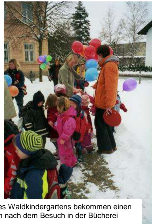
Kinder des Waldkindergartens bekommen einen Luftballon nach dem Besuch in der Bücherei